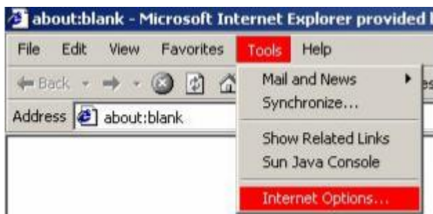
Internet Explorer 6